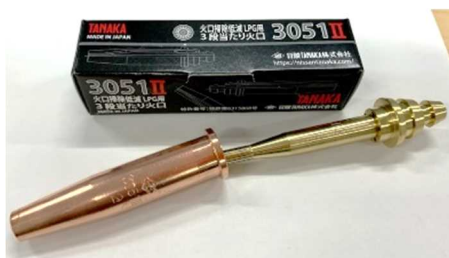
図1 3051II 火口

そこで当社は、材質変更によりスパッタが付着しにくい「3051II」(図1)を開発し、火口のメンテナンス性の向上および長寿命化を実現させた。