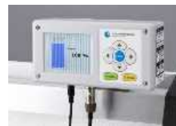
図 3 単独型表示器