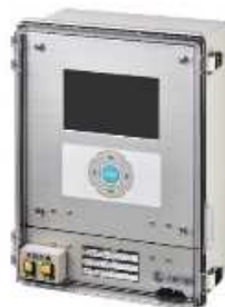
図 2 集合型表示器

この問題を解消し、かつ、液残量の視認性を向上した「BS001 型液面計」を紹介する。