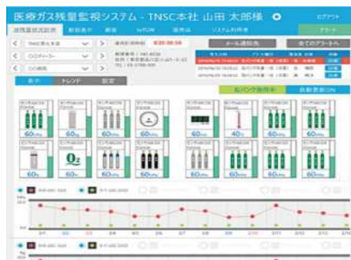
図 2 監視データ画面

監視データ閲覧画面は、グラフやイラストを多用することで視覚的に判別しやすくし、かつスマートフォン、タブレットなどでも視認性を向上させた。図 2 に Term-3 の監視データ画面を示す。