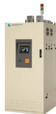
図2 VEGA-PLASMA II 外観